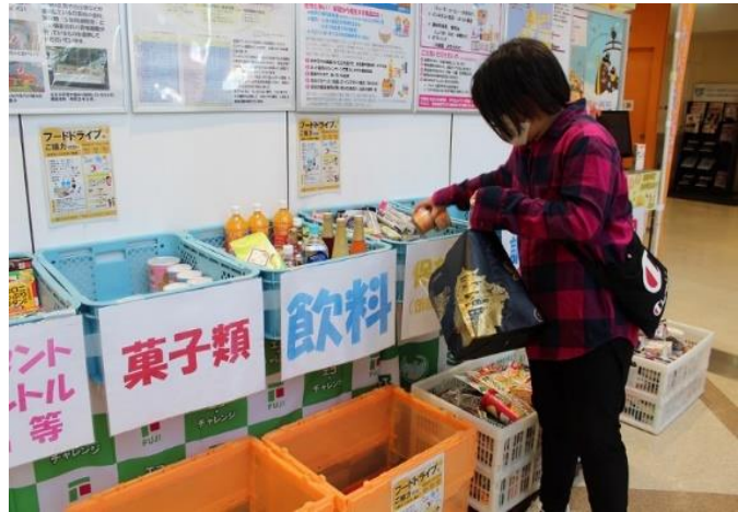
※フジグラン松山で実施した時の様子