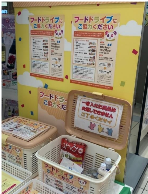
※エミフルMASAKIで実施した時の様子

お持ちいただいた食品は、NPO法人eワーク愛媛・関連支援団体を通じて食支援を必要とされている福祉施設(団体)のもとにお届けします。なお、お届け先(名称・場所)などの情報公開はいたしません。みなさまのご理解とご協力をお願いします。 詳しくはサービスカウンターまでおたずねください。