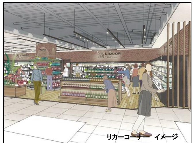
リカーコーナー イメージ

できたての惣菜はもちろん 精肉、鮮魚部門では、「ミートデリ」「魚屋の惣菜」として、産地にこだわった素材を店内加工したオリジナル商品をご提供します。照り焼きチキンや豚のあぶり焼き、焼き魚、魚の煮物・揚げ物などできたて惣菜をご家庭で温めるだけで美味しく召し上がっていただけます。またカット野菜(サラダ)やローストビーフなどの即食商品、食べきりサイズや美容や健康に配慮した商品を充実させ、単身者はもちろんファミリー世帯のニーズにも幅広くお応えします。