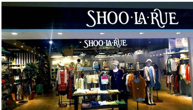
(フジグラン重信 シューラルー)