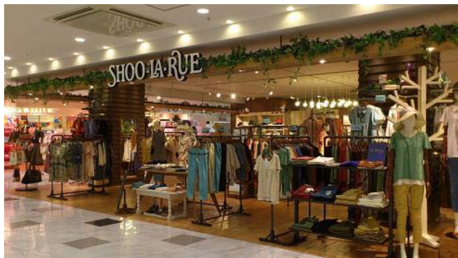
(フジグラン松山シューラルー)

10月1日付で、「フジグラン松山 シューラルー」、「フジグラン重信 シューラルー」の2店舗をワールド直営店からFCへ切替え、自主運営による「シューラルー」事業を開始します。また今年度は、愛媛県内に2店舗の新規出店を計画しており、合計4店舗体制で効率的な店舗運営に取り組みます。今後、四国全域をはじめ、中国地区の自社SC内へと展開を拡大し、他社とのさらなる差別化を図ります。