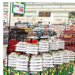
▲ 地元商品の打ち出し(フジ宿毛店)