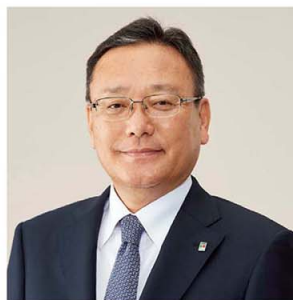
代表取締役社長 兼 COO (最高執行責任者)