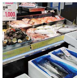
▲ 生鮮強化による差別化(フジ夏目店)

変化するお客様のニーズにお応えするため、商品やサービス、店舗機能を見直し、既存店8店舗の改装を行いました。地元ならではの商品や、毎日のくらしがより便利で楽しくなる商品の拡充、レストスペースの設置などを行いました。