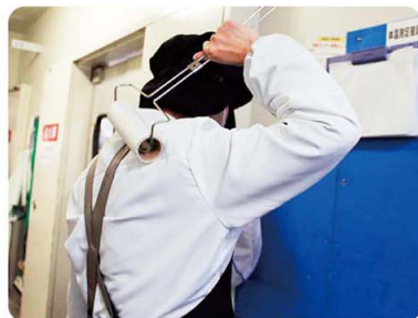
▲ 身だしなみチェック

2021年6月からHACCPに沿った衛生管理が完全施行されます。フジでは安全・安心な商品提供を行い、商品の信頼性をさらに高めていくため、先行して2020年9月からHACCPに沿った衛生管理を開始しました。以前から行っている衛生管理ルールに加え、加熱惣菜の中心温度の測定など、衛生管理の強化を図っています。