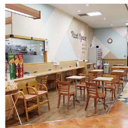
▲ レストスペースの設置(フジ西宇部店)