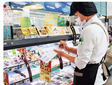
▲ 冷蔵・冷凍ケースの温度管理

※ HACCPとは、安全・安心な商品を提供するために、仕入れから販売までの過程において、起こりうる危害を想定し、対応するという衛生管理の手法です。