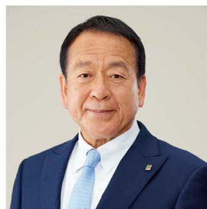
代表取締役会長 兼 CEO (最高経営責任者)